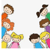
Idiomas y educación