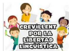
Crevillent por la Libertad Lingüística