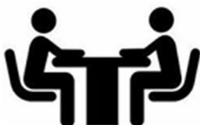
Igualdad Lingüística Calpe