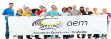
Asociación de Estudiantes del Mundo (AEM)