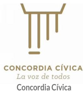
CONCORDIA CÍVICA La voz de todos Concordia Cívica