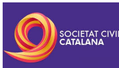
Sociedad Civil Catalana