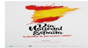
Plataforma 12 de octubre