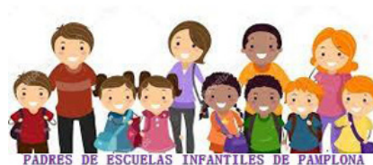
Padres de Escuelas Infantiles de Pamplona