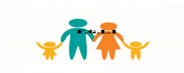
Familias gallegas por la elección del idioma